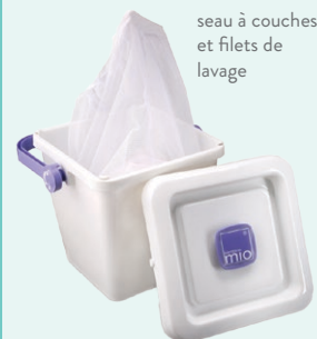
seau à couches et filets de lavage

Utilisez un seau à couches pour stocker vos couches avant le lavage. Stockez les simplement sèches dans le seau à couches jusqu'à ce que vous soyez prêt à faire une lessive. Le jour de la lessive, sortez le filet du seau et transférez directement dans la machine. Les couches seront lavées dans le filet, et vous n'avez donc pas besoin de toucher les couches sales.