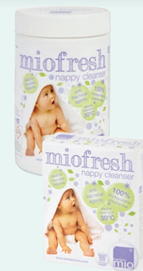
miofresh (assainissant antibactérien)

Si la couche est tachée, vous pouvez de temps en temps tremper le noyau (pas la culotte) dans une solution chaude de miofresh pendant 2 heures minimum. Utilisez 30mL de miofresh pour 5 litres d'eau. Après trempage, lavez à 40°C et rincez deux fois ensuite.†